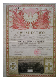
Świadectwo ukończenia szkoły podoficerskiej