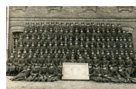
Portret grupy szkolnej kompanii strzeleckiej, promocja 1937 r.